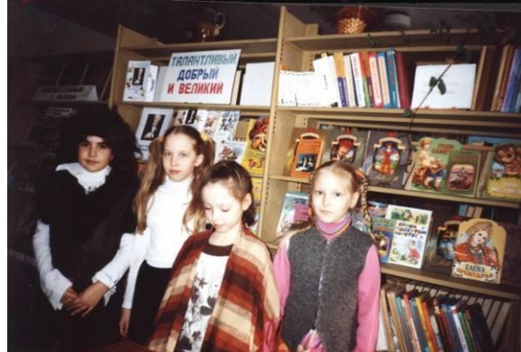
Утренник «Добрый мир Чуковского»

Праздник «Талантливый, добрый и великий», посвященный юбилею Сергея Михалкова