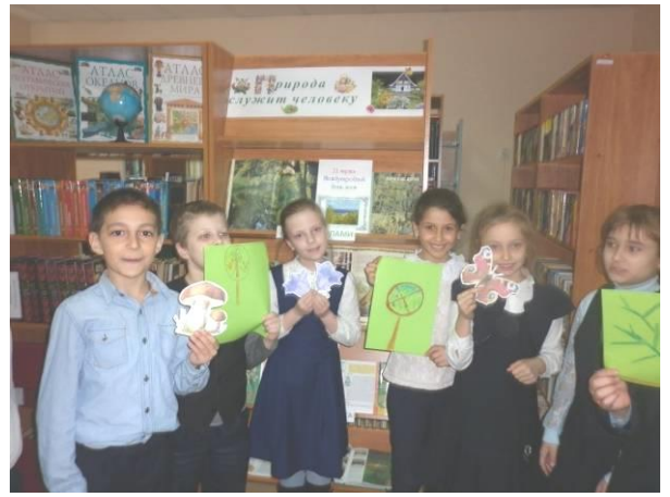
Экологический час «Природа служит человеку», посвященный Году экологии. 2017 год.