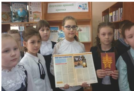
Утренник «Державной армия сильна», посвященный Дню защитника отечества. 2017 год

Среди массовых мероприятий библиотеки – утренники, литературные часы, конкурсы, познавательные беседы и часы, обзоры литературы; регулярно оформляются тематические книжные выставки.