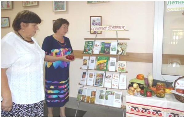
Посиделки «Летние хлопоты – осеннее застолье». 2016 г.

Библиотека ведет летопись села. В 2017 году учреждение принимало участие в районном конкурсе «Тебе и мне нужна Земля: экологическое воспитание в библиотеке».