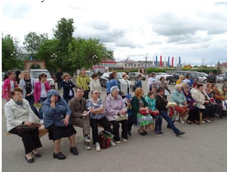
Зрители в Михайлове

Благодарим всех, кто принимал участие в акции и тех, кто просто был зрителем и слушателем!