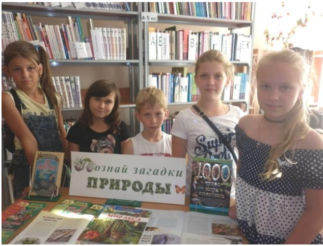
Экологическая викторина «Загадки природы», посвященная Году экологии. 2017 год.