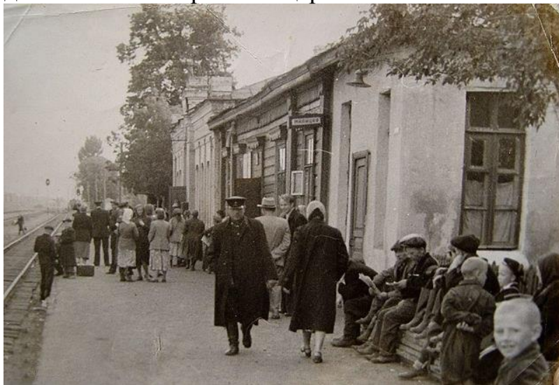
Железнодорожный вокзал в Кораблино