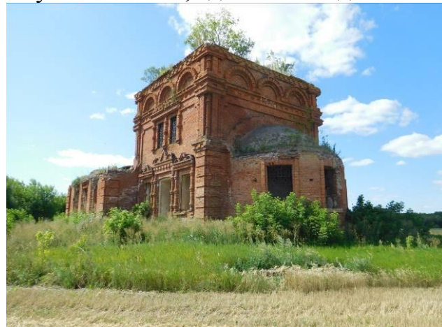
Церковь села Назарьева в наши дни