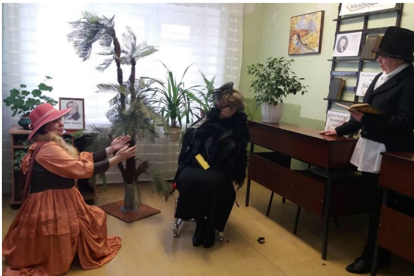
Ворона и лисица

Наша библиотека приняла участие в I Всероссийской акции «День влюбленных в Крылова», посвященной 250-летию со дня рождения знаменитого баснописца, и пригласила своих читателей на театрализованный вечер «Не рассказывайте нам басни...».