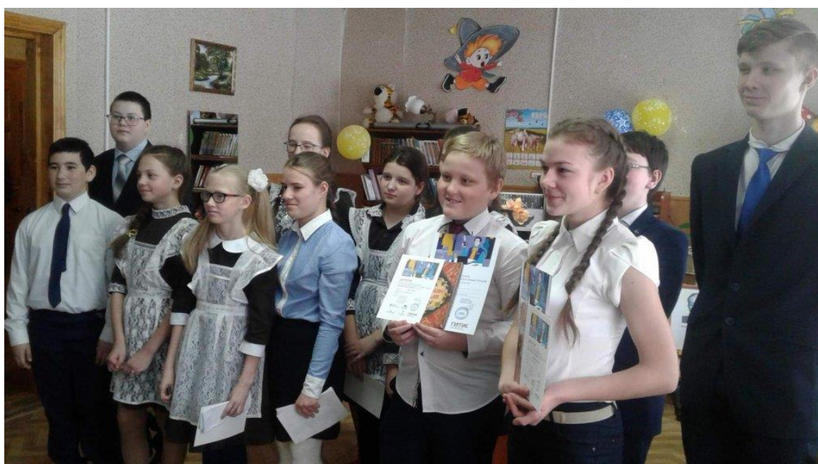
Участники конкурса в детской библиотеке

любить, мыслить и принимать решения. Надеемся, что книга станет постоянным спутником жизни участников конкурса, а также всех читателей библиотек.