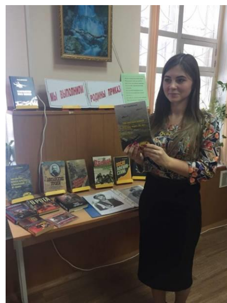
В центральной библиотеке