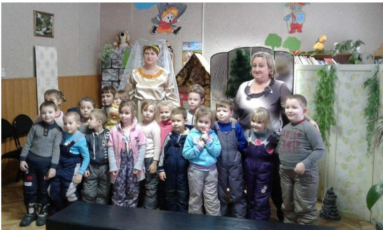
«Солнышко» в детской библиотеке