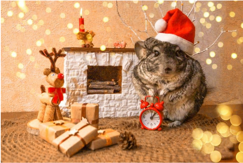
Встречаем Новый год с Масиком