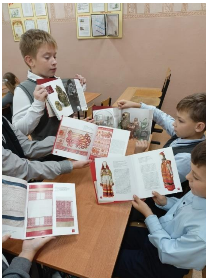
Знакомство с книгами о народных промыслах Рязанщины

Ссылка: https://vk.com/id467075853?w=wall467075853_2958%2Fall