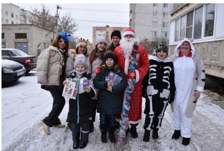
Встреча с детьми