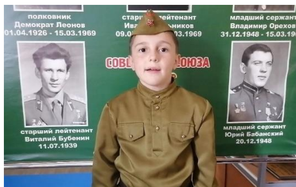
Чтение стихотворений в рамках патриотической акции «Там, где плавилась броня»