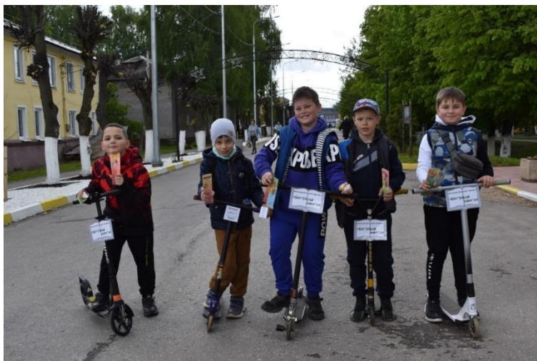
Участники акции «Бегущая книга»

Завершилась пижамная вечеринка веселой фотосессией!