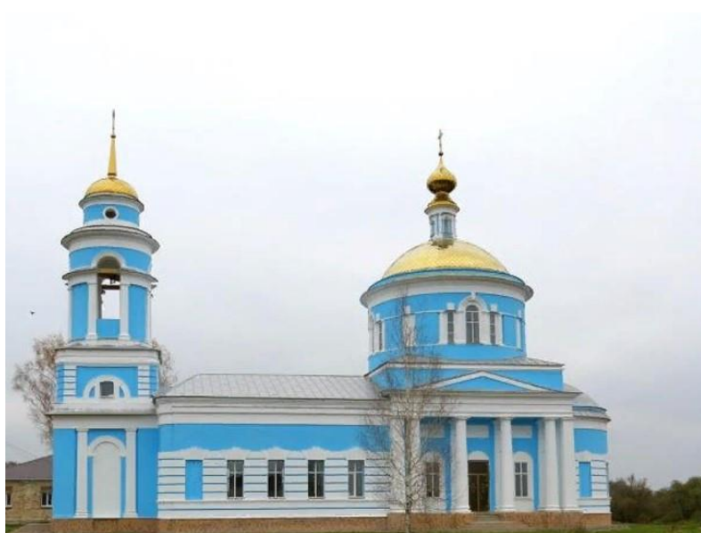
Храм Рождества Пресвятой Богородицы

В тридцатых годах храм закрыли. Там был клуб, а затем здание передали под хозяйственные нужды местному колхозу «День 9-е января». В восьмидесятых годах случился пожар, храм сгорел, так и остался стоять порушенным.