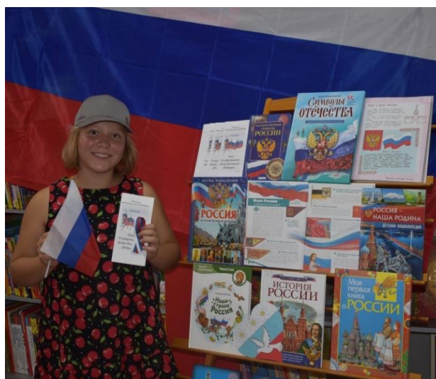
День Российского флага

Для читателей в библиотеке была оформлена одноименная книжная выставка, на которой были представлены книги о символах России. Библиотекари рассказали детям об истории создания российского флага и о том, что означают цвета триколора. Ребята делились своими знаниями о символах России и с интересом рассматривали книги. Участники получили памятки с информацией о государственном флаге, которой они смогут поделиться со своими родителями и друзьями.