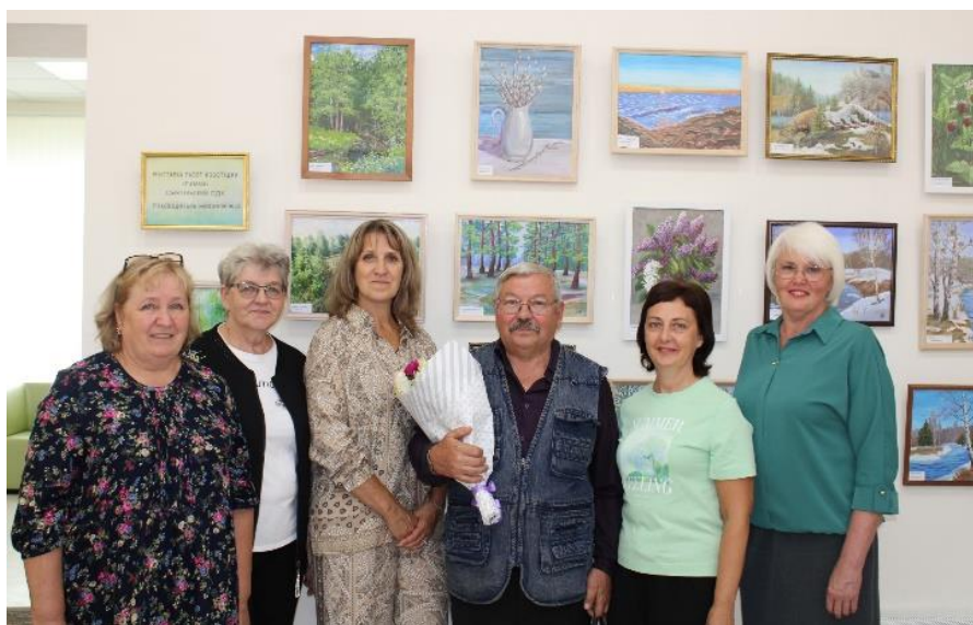
Открытие выставки Виктора Никонова

В последнее время мы становимся свидетелями глобальных преобразований, происходящих в библиотеках: из традиционных книгохранилищ они преобразуются в своеобразные центры культуры, притягивают людей разных профессий и специальностей.