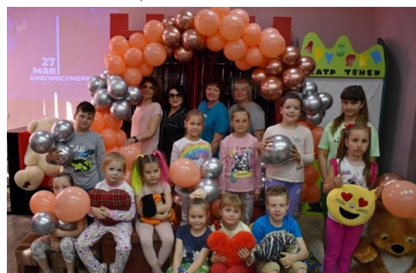
Участники пижамной вечеринки

Ссылка: https://vk.com/id467075853?w=wall467075853_2847%2Fall