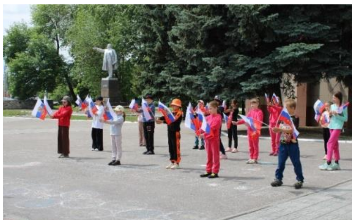
Флешмоб «Горжусь тобой, моя Россия!»