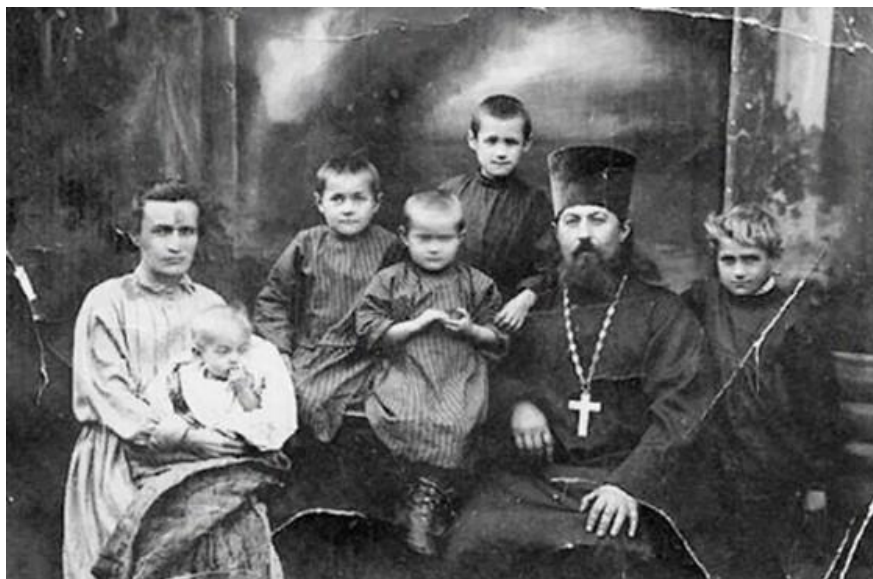
Леонид Викторов (1891–1938) священник, священномученик

8 ноября 1912 года псаломщик Леонид епископом Рязанским Димитрием был рукоположен в сан диакона, а вскоре – в сан священника, и назначен настоятелем Богородице-Рождественской церкви в селе Курбатово Рязанского уезда Рязанской