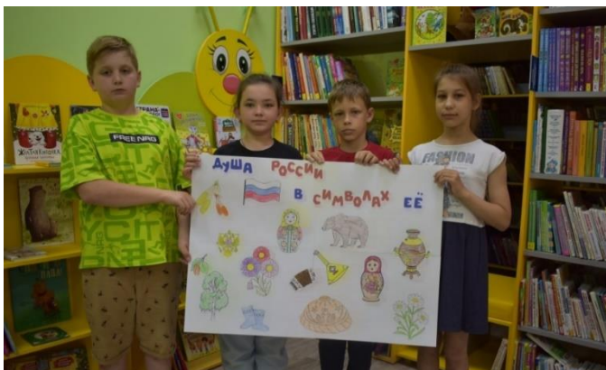
Участники патриотической акции «Рисуем большой командой великую Россию»

Ссылка: https://vk.com/id467075853?z=video467075853_456239217%2F82b2039462b0edab37%2Fpl_post_467075853_2855