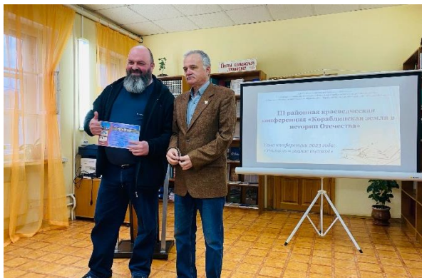
Вручение сертификатов участнику

Учителя, которые стали героями повествования, заслужили любовь и