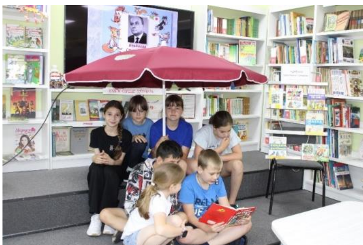
Игра-викторина «В мире сказок Владимира Сутеева»

В 2022 году с целью вовлечения детей, подростков и их родителей в проект библиотеки организовывали для них культурно-просветительские мероприятия, а также приглашали к участию в региональном читательском конкурсе