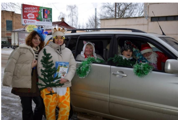
Акция «Новогодний ягомобиль: веселая доставка книг»

Ссылка: https://vk.com/id467075853?w=wall467075853_2630%2Fall