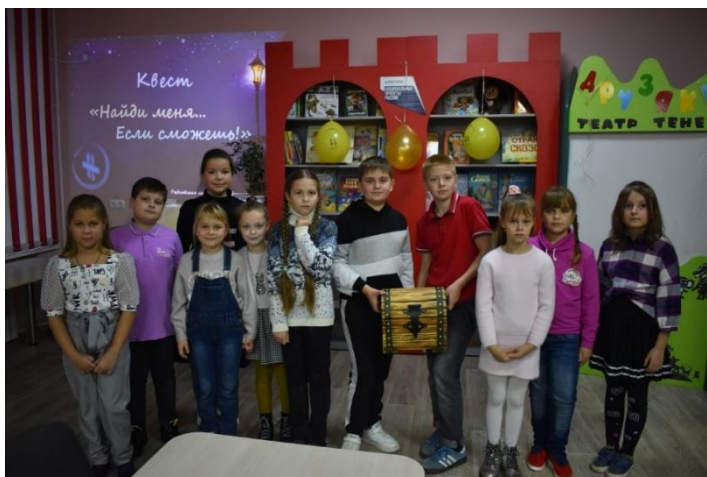
Квест-игра «Найди меня... Если сможешь!»

В этот день ребята принимали участие в квесте «Найди меня... Если сможешь!», в рамках которой выполняли интересные задания на смекалку: искали конверт с заданием, участвовали в игре «Детские фанты», танцевали зажигательный танец «Я –