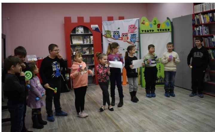
Участие в Театральном ералаше

Как и положено в театре, был здесь и антракт, во время которого ребята приняли участие в игре с неожиданным атрибутом – прищепками. После антракта посмотрели спектакль Театра теней «Друзьяки» по мотивам сказки Д. Самойлова «Слоненок пошел учиться».