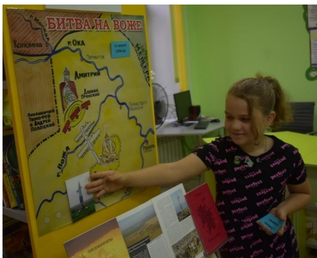
Схема битвы на Воже

11 августа 1378 года на территории села Глебово-Городище Рыбновского района состоялось великое сражение, где русское войско впервые одержало серьезную победу над войском Золотой Орды.