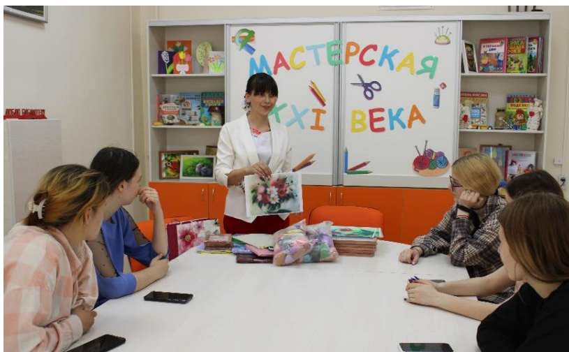
Мастер-класс «Живописью шерстью. Рисуем лебедя»

На протяжении всего проекта без внимания не оставались и начинающие художники – воспитанники Елатомской детской школы искусств и их наставники. Их работы было можно увидеть на выставке «Созвездие талантов». Картины, написанные маслом, гуашью, пастелью, графитным карандашом, словно завораживали зрителей разнообразием тем, жанров и манерой исполнения. Здесь можно увидеть притягательные портреты, солнечные, яркие, и, наоборот, грустные, немного даже мрачноватые, натюрморты, передающие все богатство природы, пейзажи, наполненные живыми красками. И вот уже зрители выражают готовность