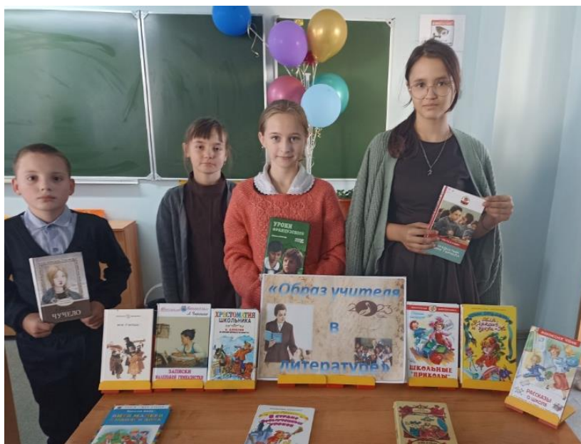
Обзор книжной выставки «Образ учителя в литературе»