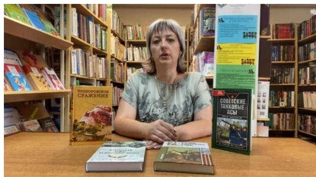
Подведение итогов акции

Все участники акции получили электронные сертификаты. И самое главное – ощутили чувство гордости за свою страну и подвиг нашего народа, а также смогли еще раз прикоснуться душой и сердцем к лучшим художественным произведениям о Великой Отечественной войне.