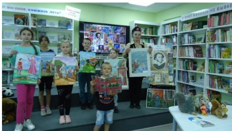
Литературно-игровой медиачас «Наш Пушкин: читаем, слушаем, сопереживаем»

Пушкинский день России – важная дата для всех жителей страны, связанная с Днем рождения величайшего отечественного поэта и писателя А. С. Пушкина. Традиционным стал литературно-игровой медиачас «Наш Пушкин: читаем, слушаем, сопереживаем». Из видеорассказа «Детство Пушкина» ребята много узнали о