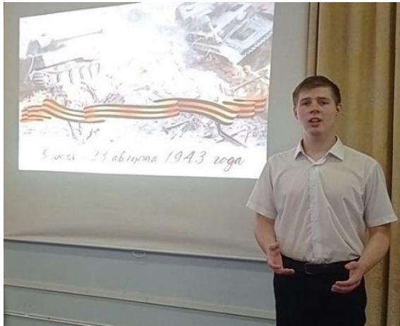
Чтение стихотворений в рамках патриотической акции «Там, где плавилась броня»