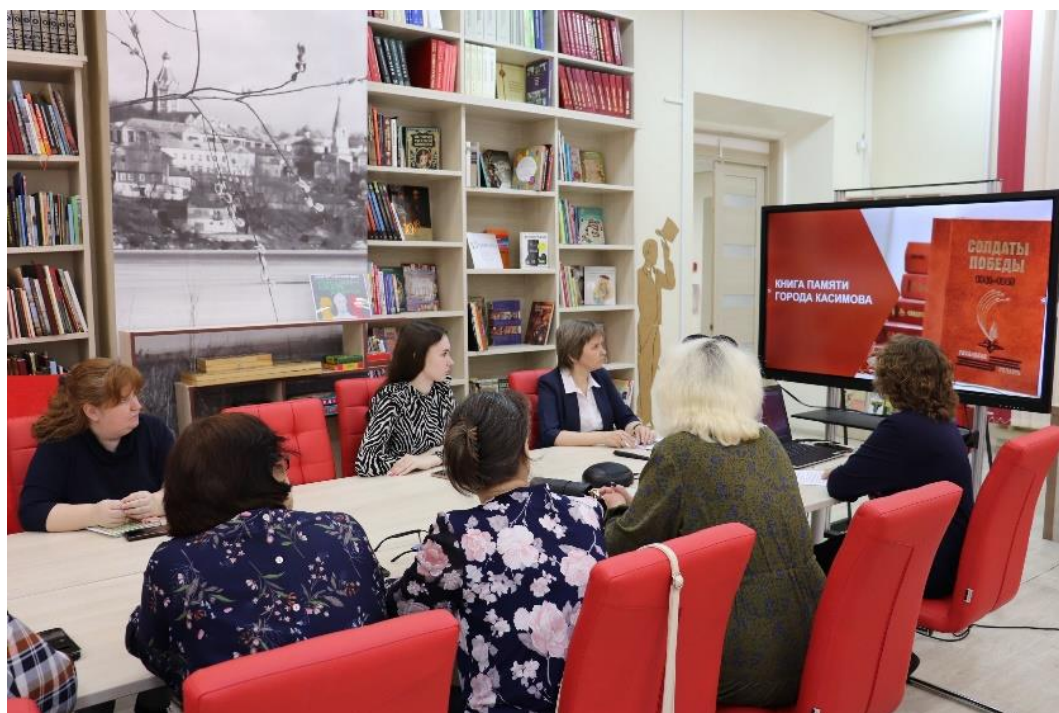
День информации «Книга памяти города Касимова»

В основу первого этапа проекта (составление общего списка ветеранов города Касимов, сверка информации о каждом участнике войны с государственной информационной системой «Память народа», сбор дополнительных сведений, документов-оснований по ним) легла масштабная поисковая работа библиотеки, проводившаяся по сбору материалов для III тома книги «Солдаты Победы. 1941–1945 гг. Рязанская область» и VI тома «Книги памяти Рязанской области», в которых аккумулированы данные об участниках Великой Отечественной войны г. Касимова и Касимовского района, погибших и вернувшихся с фронта. Это более 10 000 персоналий. В настоящее время мы отредактировали половину из них. Дополнительно были выявлены данные о 500 ветеранах, родившихся или проживавших после войны в Касимове. Найдены различные документы ветеранов, которые вместе с краткой историей выложили в Интернет их родственники.