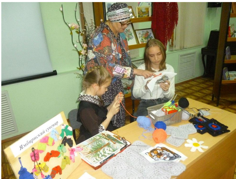
Вечерние посиделки «Народные промыслы России» в рамках Всероссийской акции «Библионочь – 2022»

оформлена выставка поделок и книг о народных промыслах и ремеслах «Культура России, традиции русского народа», которая вызвала большой интерес у гостей праздника.