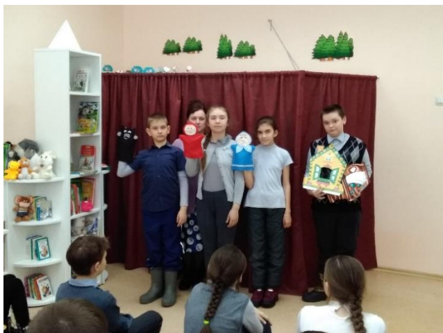
Кукольный спектакль «Красная шапочка» (руководитель А. А. Сгибнева)

«Библиопродлёнка». Модульная мебель позволяет трансформировать пространство под любой формат мероприятий. У посетителей есть широкие возможности для культурного досуга и развития талантов.