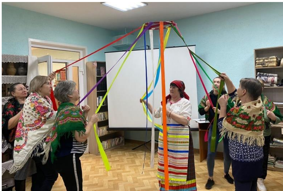
Квест-игра «Душа моя, Масленица»

Ярким и красочным получился праздник «Иван Купала», который состоялся на лугу рядом с библиотекой. На мероприятие, помимо членов клуба, собрались и местные жители. Они с интересом окунулись в атмосферу праздника, который проводился у нас впервые. Наши участницы в ярких костюмах, сшитых своими руками, в роли традиционных персонажей праздника показали для всех увлекательное представление, а также поведали о его истории, традициях и обрядах, водили хороводы со зрителями, играли в игры. На прощание, когда наступили сумерки, зажгли купальский костер, вокруг которого все присутствующие завели большой хоровод. А когда огонь немного угас, парни и девушки