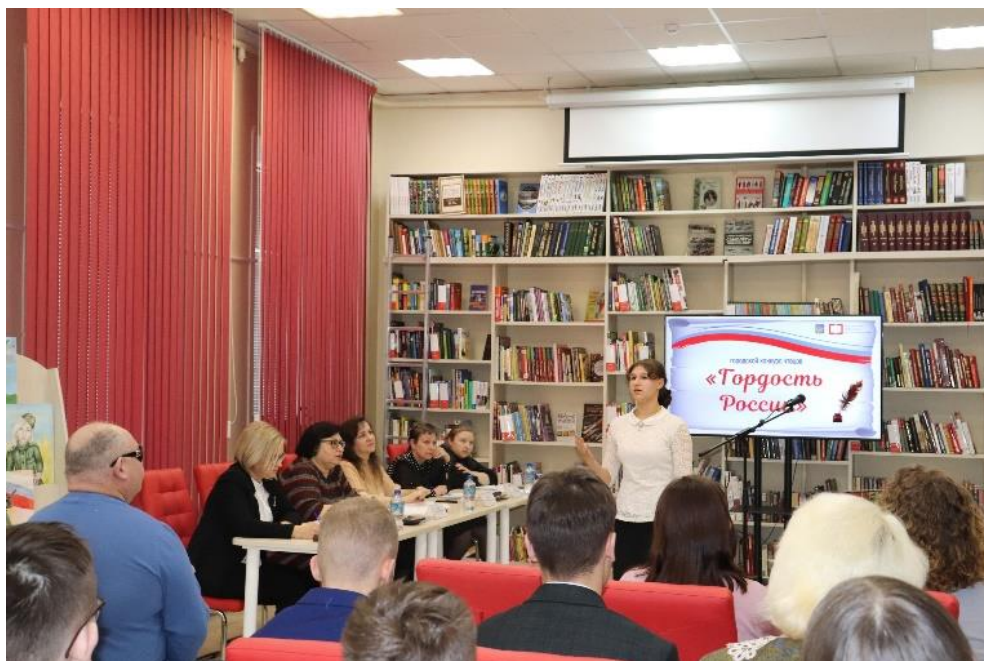
Конкурс чтецов «Гордость России»

Одна из эффективных форм работы – организация массовых мероприятий для школьников и студентов. В 2022 году было проведено 118 мероприятий с участием более двух тысяч человек. Во всех библиотеках города проводились циклы мероприятий, посвящённых государственным праздникам, Дням воинской славы, событиям, сыгравшим важную роль в становлении российской государственности и гражданского общества, юбилейным датам выдающихся деятелей в области науки, культуры, искусства, общественной деятельности и других отраслей. В их числе – тематические вечера, беседы, встречи, дни памяти, литературно-музыкальные композиции, уроки мужества, виртуальные экскурсии, заседания клубов, конкурсы, акции, научно-практические конференции, презентации, видеомосты. Подготовка к ним ведётся с привлечением достоверных информационных ресурсов, в том числе – фондов Национальной и Президентской электронных библиотек.