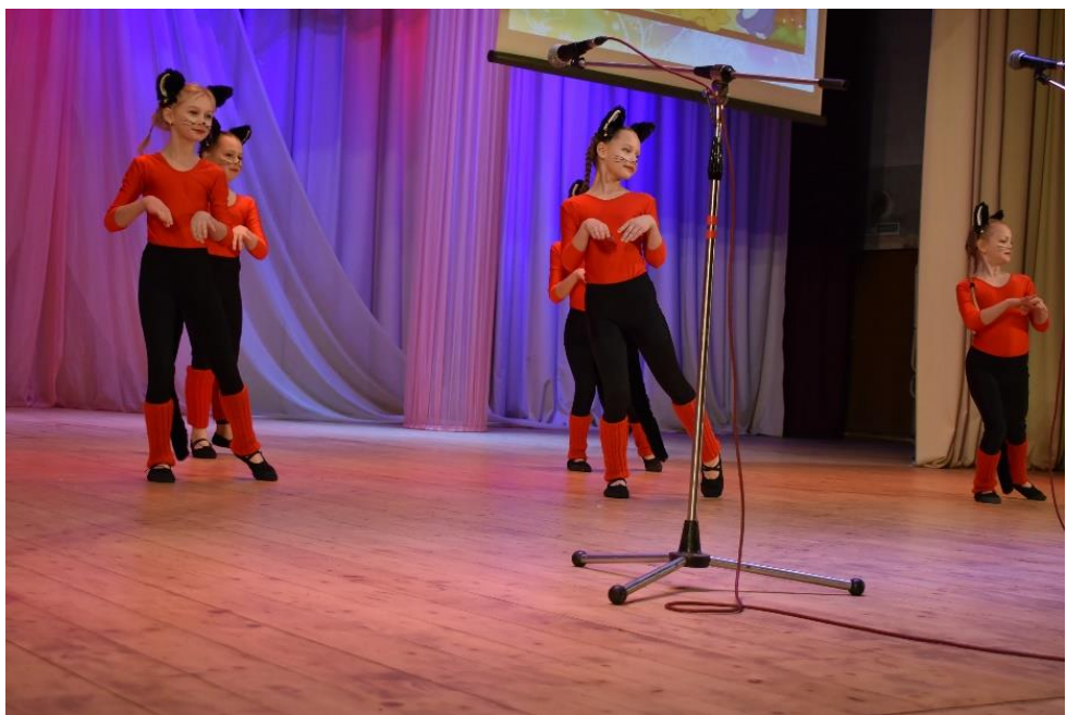
Танец под песенку «Невоспитанная кошка» в исполнении хореографического коллектива «Тандем»