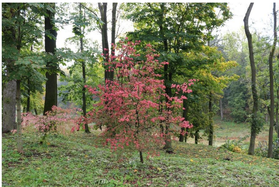
Осень в Ерлинском парке.