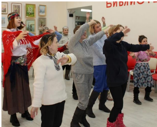
Участники тематического вечера «Вам дарим доброту и радость»

К Международному дню инвалидов прошел тематический вечер «Вам дарим доброту и радость». Для жителей Елатомского и Иванчиновского психоневрологических интернатов была подготовлена программа с играми и конкурсами. Гости приняли участие в шуточном