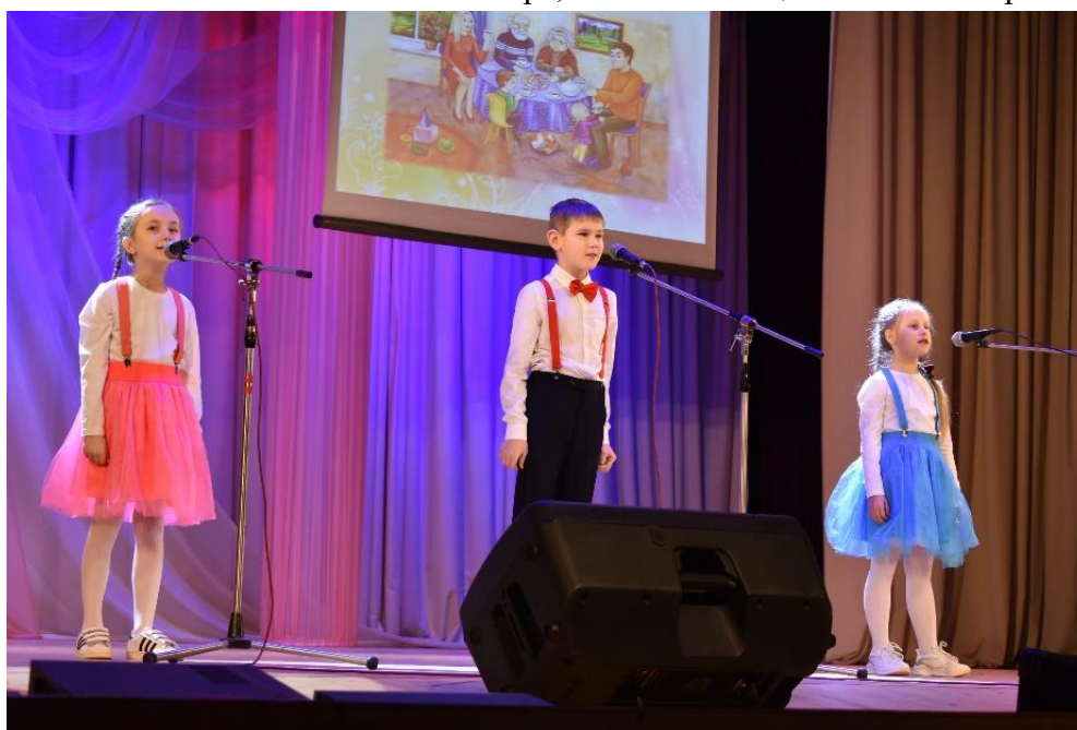
Участники вокальной студии «Голосок»