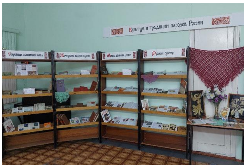
Выставка-просмотр литературы «Культура и традиции народов России»

В Шацкой межпоселенческой библиотеке состоялось открытие выставки-просмотра литературы «Культура и традиции народов России». Гостей и читателей познакомили с разделами выставки «Богатство страны – народное искусство», «Сокровища славянского быта», «Жемчужина народной мудрости» и др. Ведущие рассказали об особенностях национального костюма, танца и песен регионов страны, обратили внимание на разнообразный материал о самых популярных видах прикладного мастерства в России. Наибольший интерес у присутствующих вызвали разделы, посвященные родному краю: «Рязанский край: обычаи, культура», «Золотая россыпь народного фольклора», «Чудеса народных промыслов». Собравшихся познакомили с редкими документами о мастерах и художниках Рязанской области, фольклорном наследии Шацкого района. На выставке были представлены изделия из дерева и бисера, вязанные и глиняные игрушки, сделанные руками учащихся Шацкой детской школы искусств, Шацкого Дома детского творчества и читателей библиотеки.