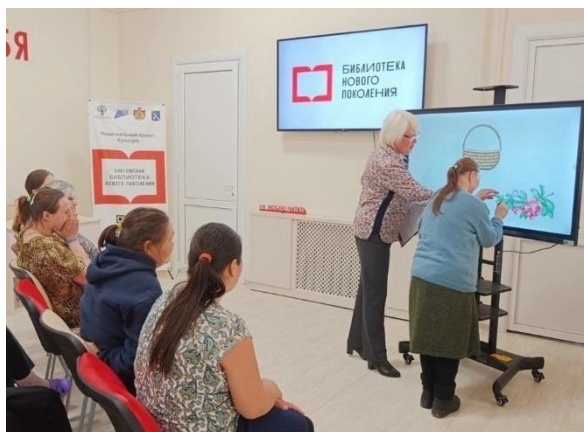
Эко-путешествие «Русский лес – край чудес»

При проведении мероприятий сотрудники библиотеки часто используют мультимедийную технику, которая была приобретена в рамках национального проекта «Культура». Эко-путешествие «Русский лес – край чудес» познакомило гостей мероприятия с богатствами русского леса, они услышали легенды о грибах, узнали о происхождении названий ягод и о пользе лекарственных растений. На мероприятии гости отвечали на вопросы, выполняли задания, отгадывали загадки и, используя интерактивную панель, собирали в лукошки щедрые дары леса.