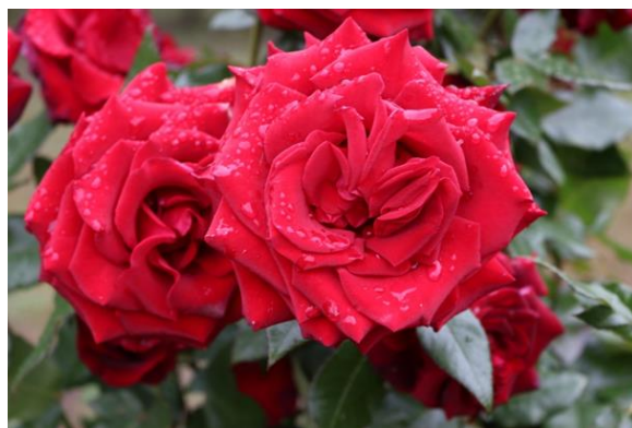
Ерлинские розы.