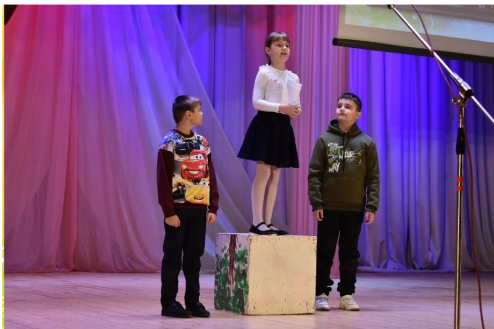
Инсценировка стихотворения «Вкусные конфеты»

«Ленивый портфель», «Тётушка слякоть», «Модница», «Испорченный котик», «Спать не хочет медвежонок», «Доктор».