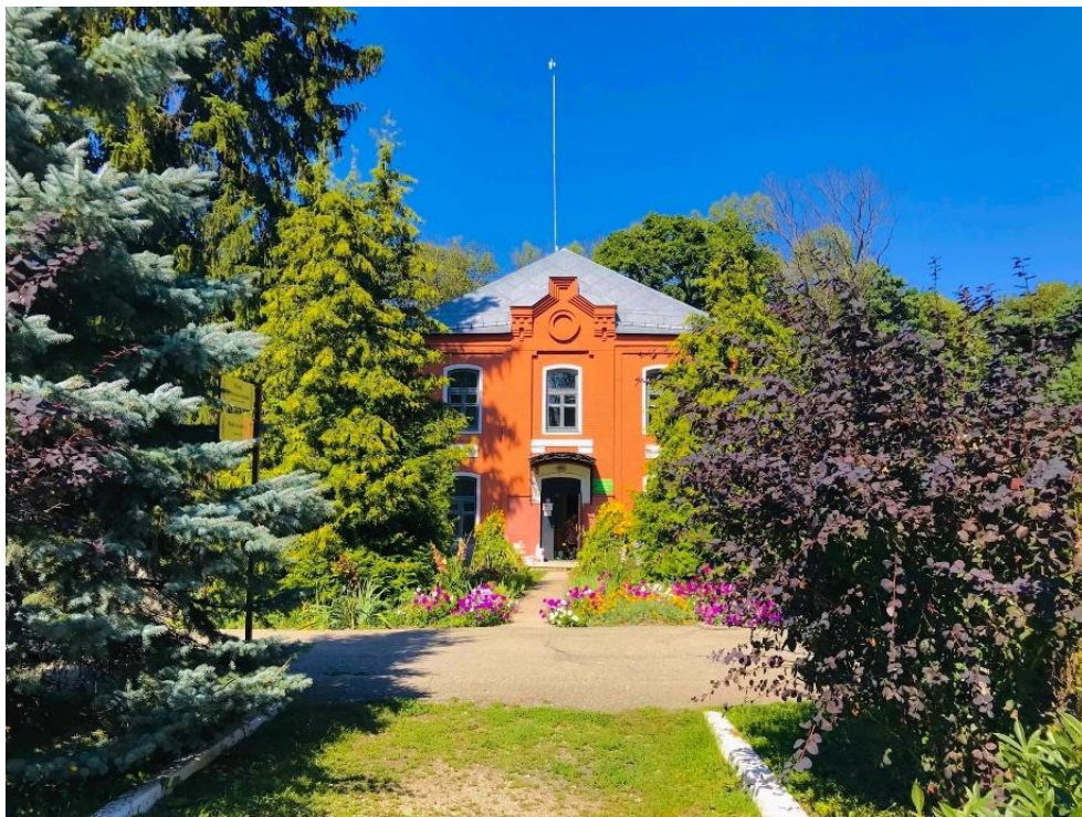
Ерлинская школа.

Н. Мурадова «Это старинное здание школы»