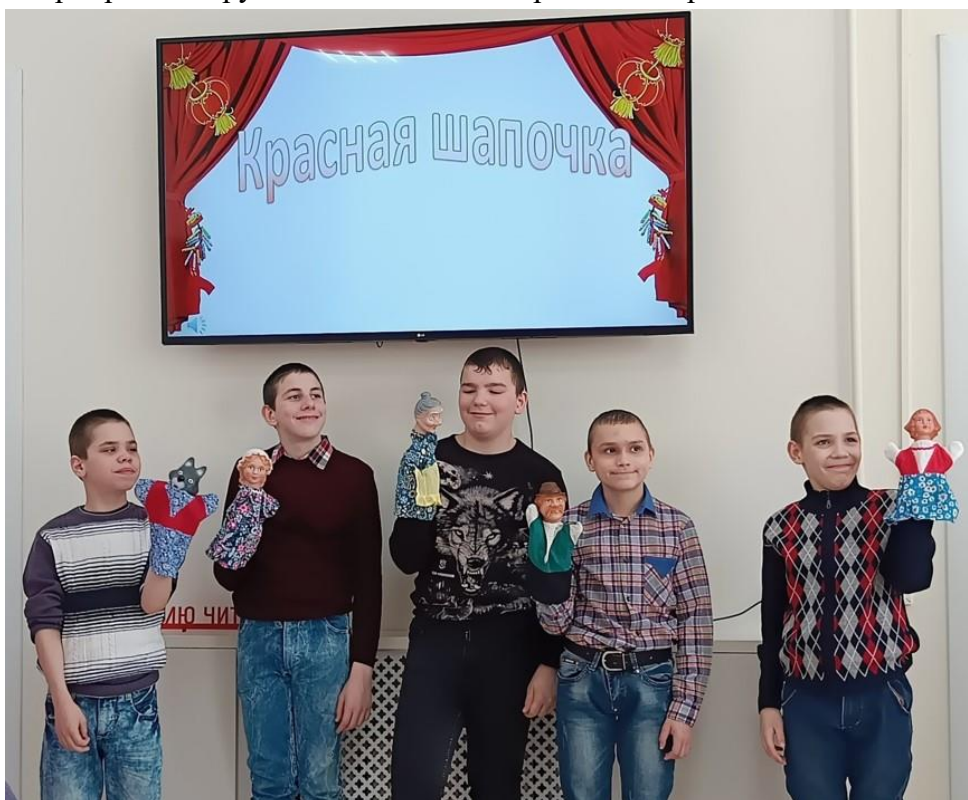
Театральный час «И...оживают куклы!»

К Международному дню театра для особенных детей в библиотеке состоялся театральный час «И...оживают куклы!». Библиотекарь рассказала ребятам об истории возникновения кукольного театра, о том, какие они бывают, а также познакомила с пальчиковыми и перчаточными персонажами. Дети с удовольствием попробовали себя в роли кукловодов и разыграли спектакль по сказке Шарля Перро «Красная шапочка», а в завершении мероприятия дружно отвечали на вопросы викторины.