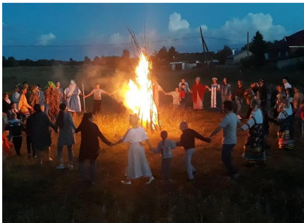
Купальский костер на празднике Иван Купала

Ярким и красочным получился праздник «Иван Купала», который состоялся на лугу рядом с библиотекой. На мероприятие, помимо членов клуба, собрались и местные жители. Они с интересом окунулись в атмосферу праздника, который проводился у нас впервые. Наши участницы в ярких костюмах, сшитых своими руками, в роли традиционных персонажей праздника показали для всех увлекательное представление, а также поведали о его истории, традициях и обрядах, водили хороводы со зрителями, играли в игры. На прощание, когда наступили сумерки, зажгли купальский костер, вокруг которого все присутствующие завели большой хоровод. А когда огонь немного угас, парни и девушки