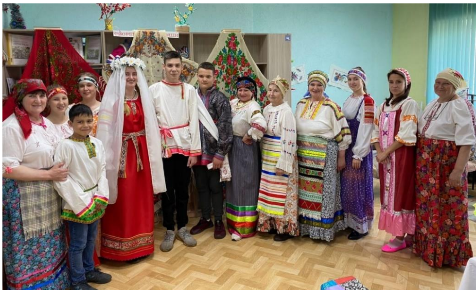
Библионочь «Радуга народных традиций»

С участием членов клуба «Беседушка» познавательно и увлекательно проходят в библиотеке Всероссийские акции «Библионочь» и «Ночь искусств». Для проведения этих мероприятий приглашаем гостей: творческих людей, мастеров прикладного творчества, музыкантов. Незабываемо прошли мероприятия «Библионочи»: «Один вечер в мире книг», «Вечер в кругу друзей» в рамках юбилея библиотеки, квест-игра «Тайны космоса», фольклорные посиделки «Радуга народных традиций» с рассказом об обрядах нашего села и реконструкцией старинного обычая выкупа невесты. А также мероприятия «Ночи искусств»: «Осенний марафон ремесел», «А у нас – Казанская, престольный праздник с. Благие». Яркие, интересные, костюмированные праздники дарят незабываемые впечатления присутствующим и остаются в памяти надолго.