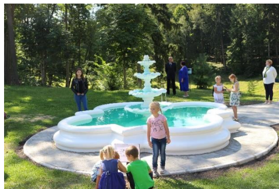
Фонтан «Цветок» в день его открытия после реконструкции

Как известно, неперенным атрибутом традиционной дворянской усадьбы XVIII – XIX веков был пруд или каскад прудов. Имение Худекова не было в исключении. В его прудах водились белые и чёрные лебеди, что придавало усадьбе живописный вид.