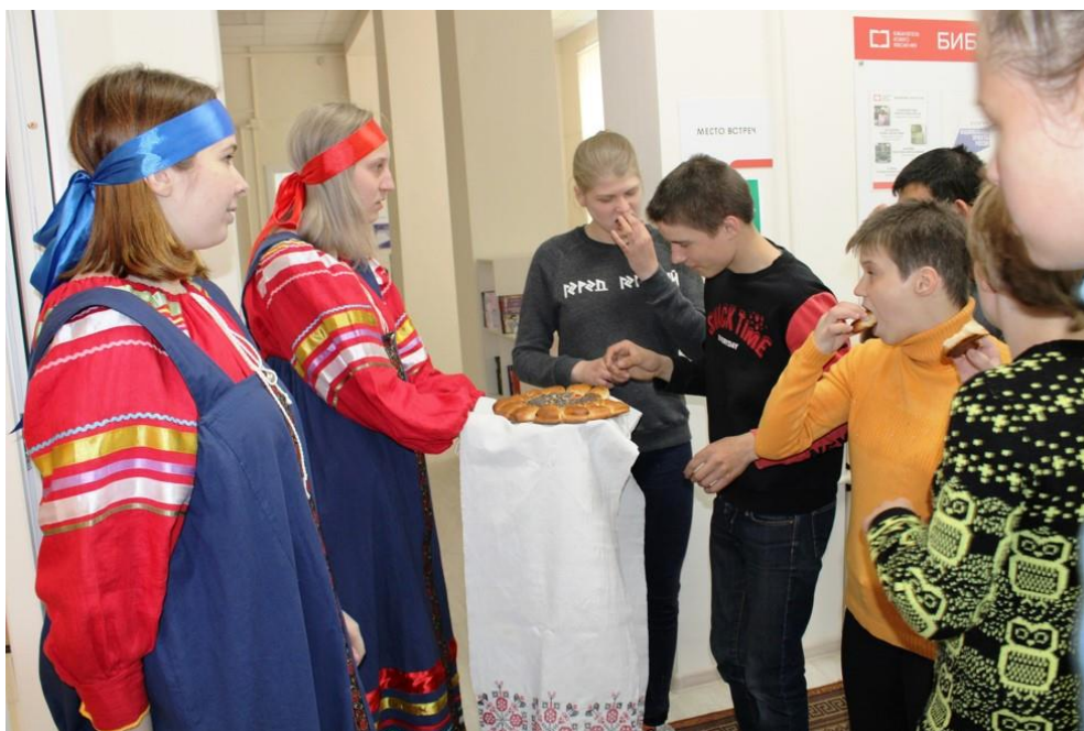
Вечер веселых затей «Традиции, которыми мы живем» в рамках акции

К Международному дню театра для особенных детей в библиотеке состоялся театральный час «И...оживают куклы!». Библиотекарь рассказала ребятам об истории возникновения кукольного театра, о том, какие они бывают, а также познакомила с пальчиковыми и перчаточными персонажами. Дети с удовольствием попробовали себя в роли кукловодов и разыграли спектакль по сказке Шарля Перро «Красная шапочка», а в завершении мероприятия дружно отвечали на вопросы викторины.