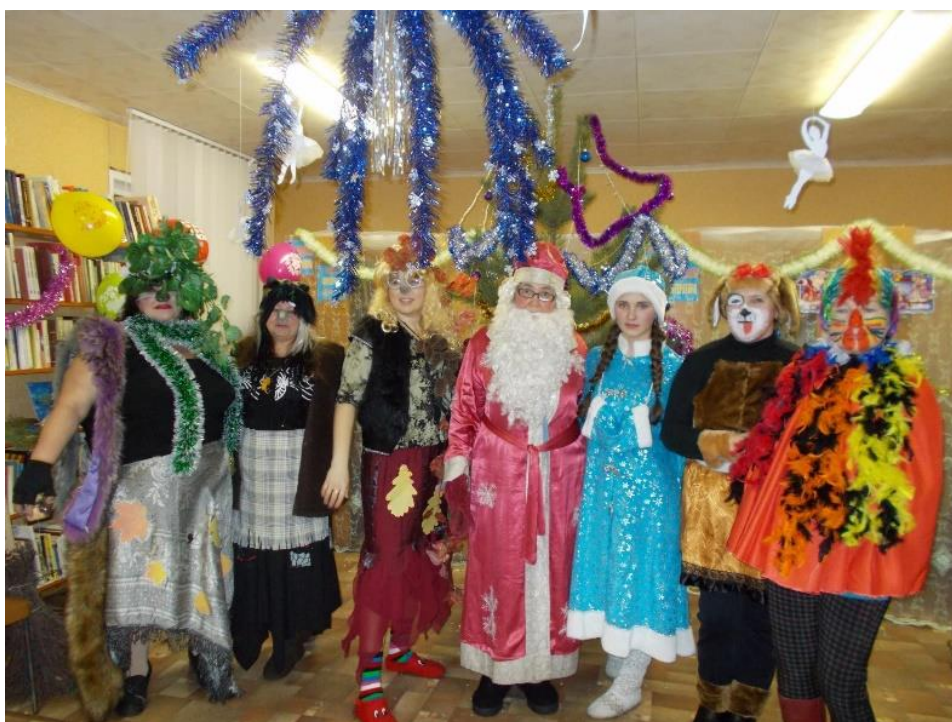
Праздничное представление «Новогодний переполох»

К новогоднему празднику члены клуба готовят праздничные представления: «А Баба Яга – против», «Новогодний переполох», «Как-то раз под Новый год», «Приключения в Новогоднем лесу», «Сказки разные бывают», которые всегда проходят весело и интересно. Для этих представлений наши участницы шьют костюмы, старательно учат тексты своих персонажей, выбирают время для репетиций и очень волнуются перед выступлением. Посмотреть представления приходят родственники и друзья наших участниц. А два последних спектакля были показаны на сцене нашего нового Дома культуры, где был полный аншлаг.