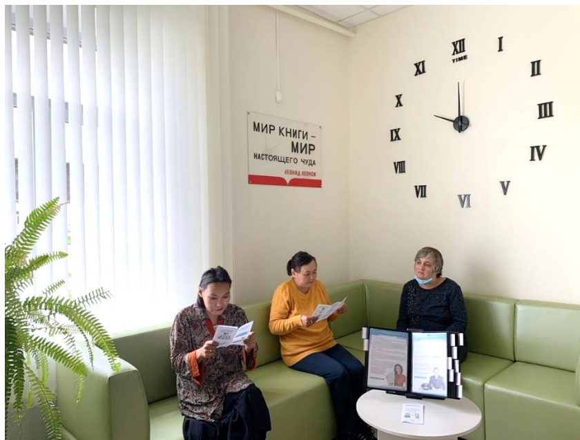
Информационное пространство Елатомской поселковой библиотеки

При модернизации библиотеки в 2021 году в рамках реализации национального проекта «Культура» большое внимание было уделено максимальному использованию полезного пространства, зонированию в соответствии с пожеланиями читателей. Большое внимание было уделено людям с ограниченными возможностями здоровья. Для этой категории пользователей предусмотрены пандусы на центральном входе и запасном входе, кнопка вызова персонала, санитарные помещения оборудованы поручнями. В фойе создано информационное пространство, где люди с ОВЗ могут получить справочную и консультативную помощь в решении различных вопросов.