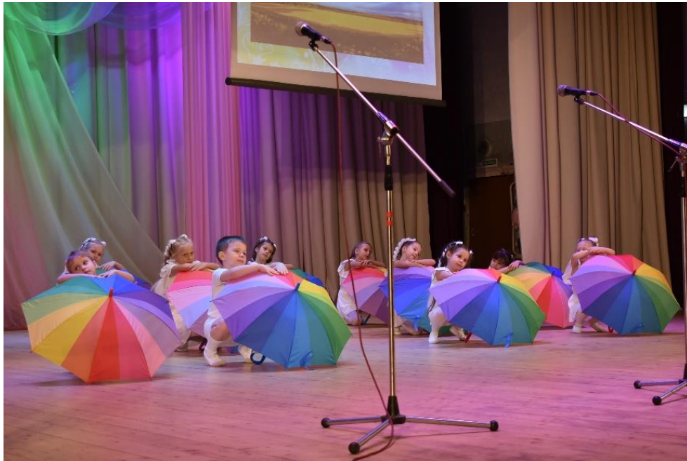
Танец под песенку «Грибной дождь» в исполнении народного спортивно-хореографического ансамбля «Антарес»