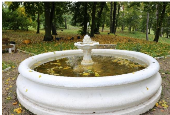
Фонтан в парке.