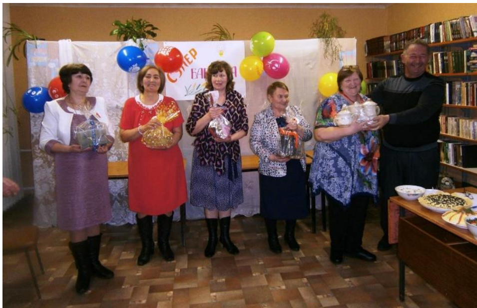
Конкурсная программа «Супер-бабушки»

С участием членов клуба «Беседушка» познавательно и увлекательно проходят в библиотеке Всероссийские акции «Библионочь» и «Ночь искусств». Для проведения этих мероприятий приглашаем гостей: творческих людей, мастеров прикладного творчества, музыкантов. Незабываемо прошли мероприятия «Библионочи»: «Один вечер в мире книг», «Вечер в кругу друзей» в рамках юбилея библиотеки, квест-игра «Тайны космоса», фольклорные посиделки «Радуга народных традиций» с рассказом об обрядах нашего села и реконструкцией старинного обычая выкупа невесты. А также мероприятия «Ночи искусств»: «Осенний марафон ремесел», «А у нас – Казанская, престольный праздник с. Благие». Яркие, интересные, костюмированные праздники дарят незабываемые впечатления присутствующим и остаются в памяти надолго.