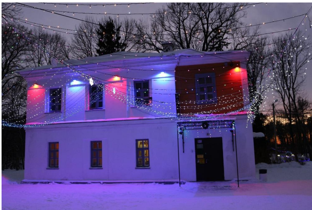
Здание Ерлинского музея