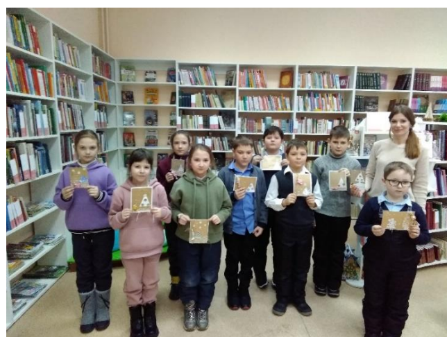
Участники творческой лаборатории «Вдохновение» на мастер-классе «Открытие с сюрпризом»

В кукольном театре и детской театральной студии юные артисты осваивают азы театрального искусства. Занимается с ними библиотекарь