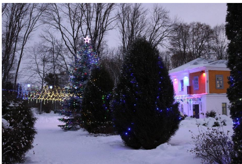
Новый год в Ерлинском парке

В 2020 году, когда новогодней столицей была выбрана Рязань, в праздничные дни центральная аллея парка, здание музея, беседки и фонтан засияли разноцветными огоньками гирлянд. На мосту зажгли фонари и в Ерлинский парк пришла «Рождественская сказка». В эти дни на территории музея-заповедника «Усадьба С. Н. Худекова» прошли народные гуляния. Возле нарядной ёлки гостей встречали Дед Мороз, Снегурочка, Рязанский Косопуз, Авдотья Рязаночка, Княжна Забава, богатырь Евпатий Коловрат.