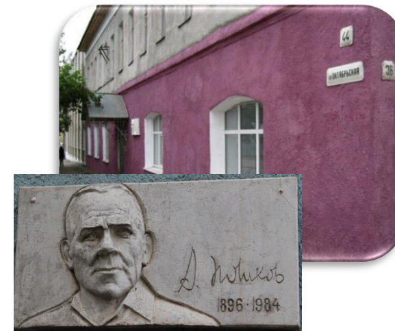
Детская музыкальная школа