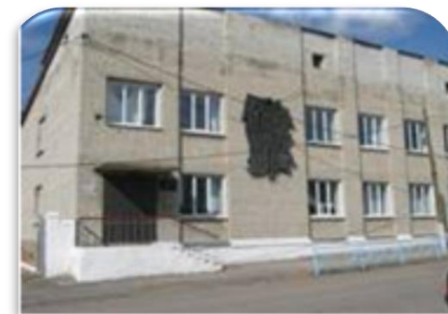
Детская художественная школа