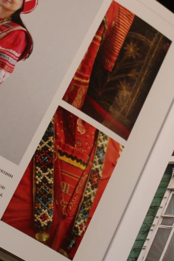
1. Воссозданный народный костюм из коллекции Клевиковского районного дома культуры. 2-3. Элементы костюма района Куриш Касимовского уезда. XIX – начало XX в. Выставка «Помеи, гачки и рога...», РИДМЗ. 4-6. Деревянное кружево мешёрских наличников. Деревни Клевиковского и Касимовского районов.