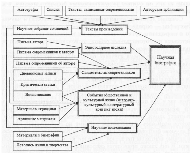
Схема 1. Основные источники научной биографии писателя

Как показывает схема, источники научной биографии достаточно разнообразны. При подготовке этого научного труда необходима выработка критериев отбора материала. В зависимости от авторского замысла и концепции научной биографии эти критерии могут быть различны. Однако, обусловленные общим замыслом и структурой научной биографии, они должны последовательно соблюдаться во всем исследовании. При определении общего замысла работы принципиально важно сформулировать главную идею жизни персонажа, которому посвящено жизнеописание. Это позволяет автору научной биографии четко определить идею своего биографического исследования и в соответствии с ней отбирать и группировать доступный ему биографический материал. Отбор материала необходим и в связи с тем, что, как отмечает В. А. Мануйлов, «часто бывает так, что случайные, второстепенные материалы до нас доходят, а важнейшие источники бесследно исчезают. Из этого хаоса случайно сохранившегося материала биограф отбирает все существенное, характерное, типическое и, сопоставляя различные свидетельства и источники, строит научную историю жизни и деятельности своего героя» 1 .