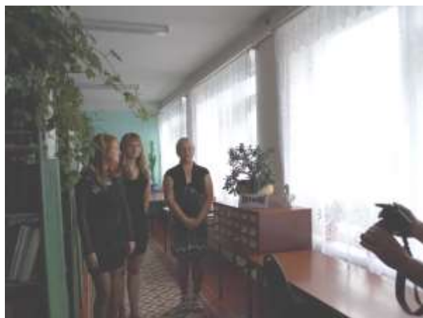
Экскурсию по библиотеке проводят старшеклассники Муравлянской средней школы