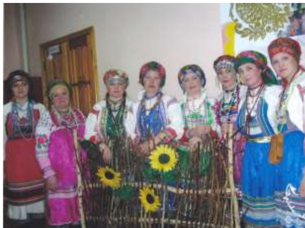
«Келуня» на библиотечных праздниках

Вот уже 5 лет ансамбль радует сельчан и гостей села своими песнями, часто выезжает на гастроли в соседние районы, участвует в областных и межрегиональных конкурсах. При местном доме культуры уже 10 лет звенит детский «Колосок» и более 20 лет поёт «Семеновна».