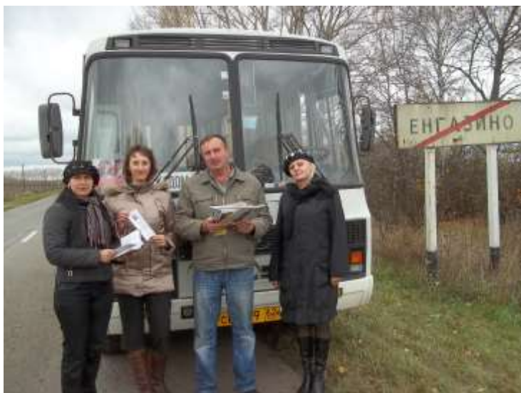
... в центре – водитель автобуса, слева – сотрудники Центральной библиотеки

«Читающий автобус» по маршруту Кадом - Енкаево