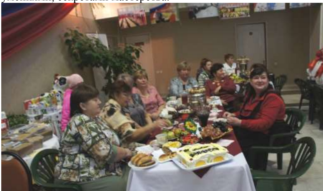
На одном из заседаний «Хиринских вечорков».

На мероприятиях в библиотеке выступают представители всех сфер деятельности: медицины, культуры, общепита, - делятся своими знаниями и умениями, секретами мастерства.