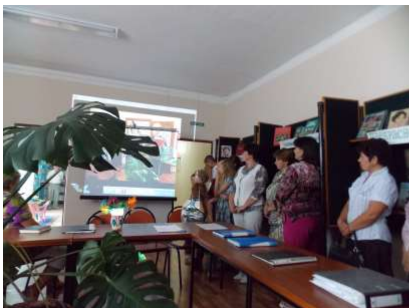
Читальный зал библиотеки