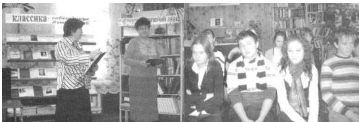
Печать: Кондрашова Н. Выбор всегда есть/Н. Кондрашова// Родные истоки.-2010.-10 декабря.

Встреча получилась разносторонней, все старались быть откровенными. Порадовало, что большинство подростков правильно определили главные жизненные ценности. Хочется надеяться, что каждый из них вынес для себя главное: «Выбор всегда есть!»