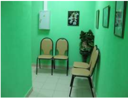
Уголок для читателей