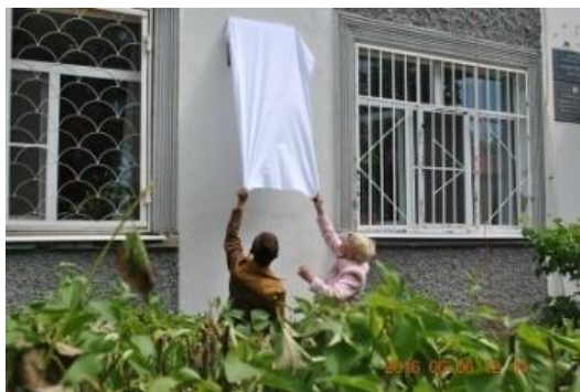
Открытие мемориальной доски на здании редакции