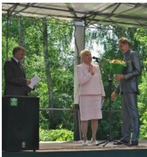
Поэтический праздник в честь открытия мемориальной доски

В целях продвижения творчества местных поэтов литературное объединение «Кораблинские родники», которое действует при Центральной библиотеке, организует проведение поэтических праздников в соседних районах. 16 июля в музее-усадьбе «Мемориальный комплекс М.Д. Скобелева» в с. Заборово Александровского района состоялся поэтический праздник «Слова созвучны музыке земли...». В празднике приняли участие литературные объединения из Александровского, Кораблинского, Рязанского, Сапожковского, Шиловского районов области, а также Староюрьевского района Тамбовской области.